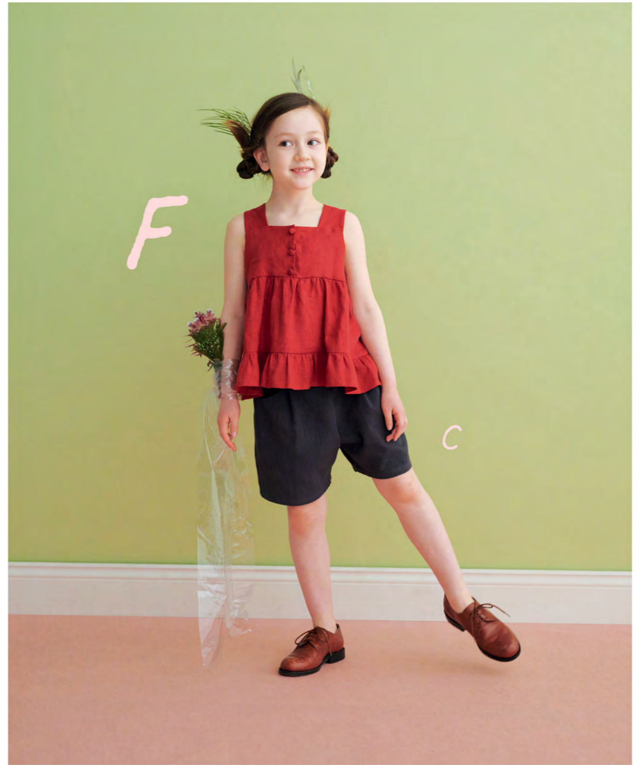
F ティアドトップス → page. 48

ボリュームたっぷりの3段のスカートを含めたティアドワンピース。薄手のデニムで作れば、ギャザーもきれいに入ります。