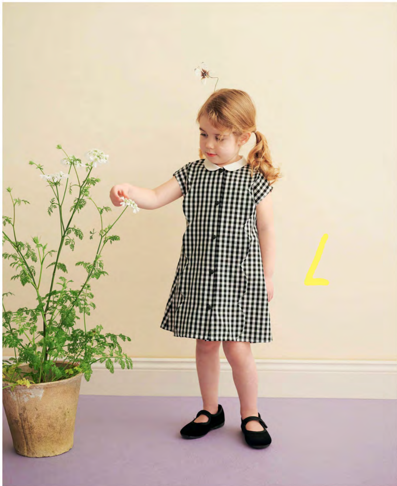
L スクラップワンピース