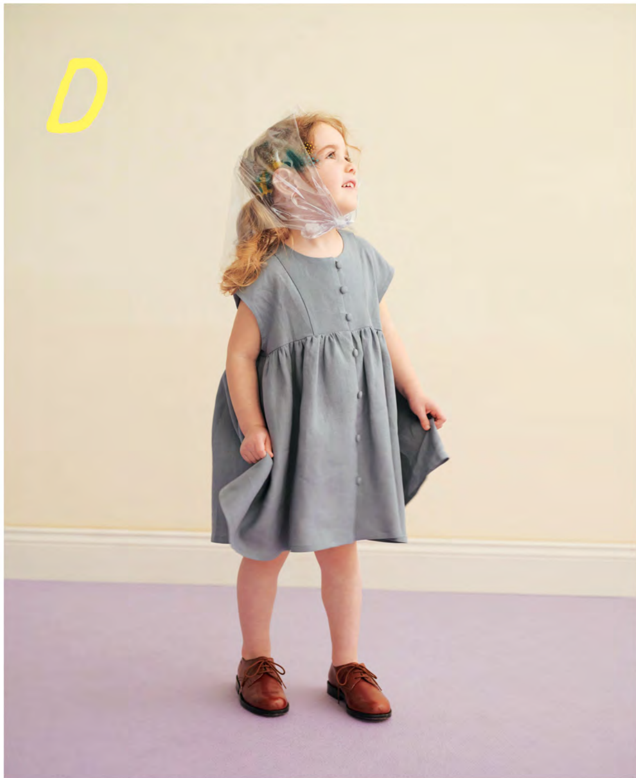
D ギャザーワンピース (フレンチスリーブ) → page. 43

並んだくるみボタンがかわいいフレンチスリーブのワンピース。 きれいな色のリネンで仕立てました。思わずくるくる回りたくなる ワンピースです。