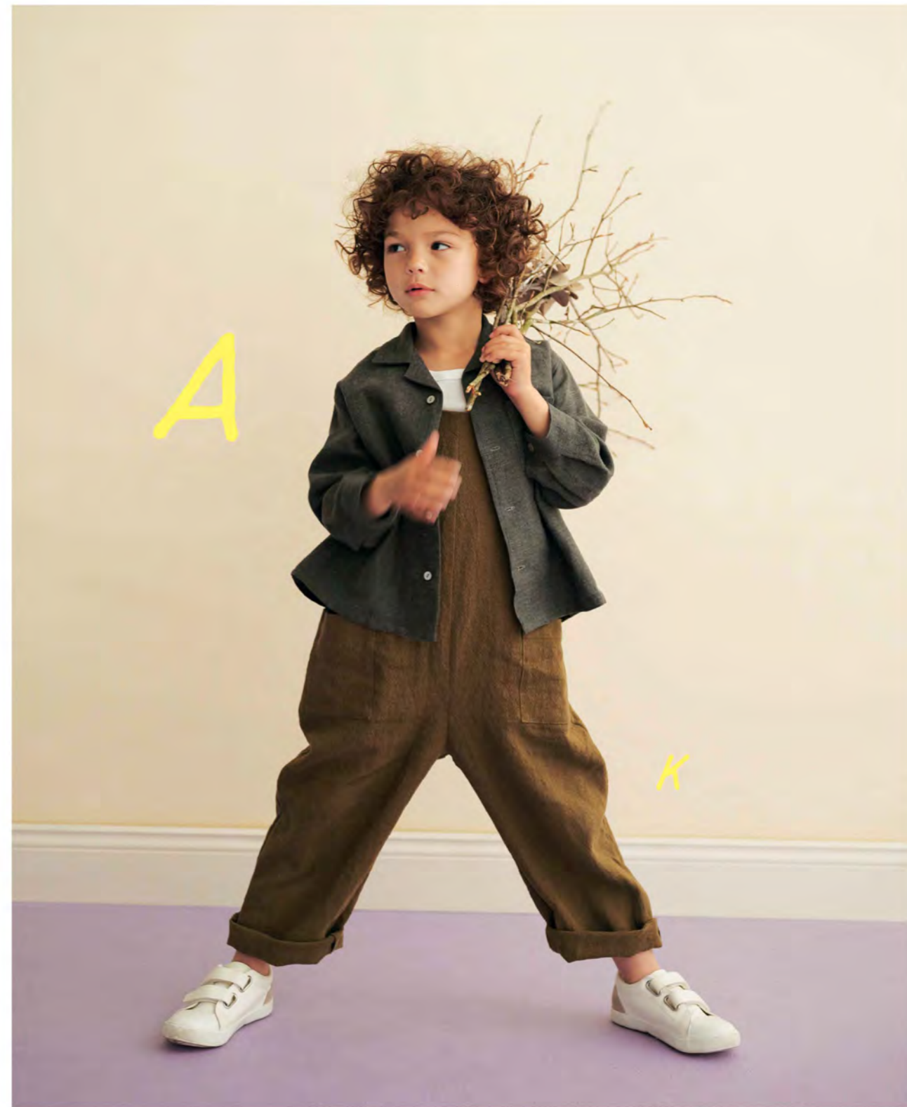
A オープンカラーシャツ (ロングスリーブ)

前身頃に大きなスクラップが入ったワンピース。小さな衿にタイトなシルエットが上品だけれど、個性的な一着です。