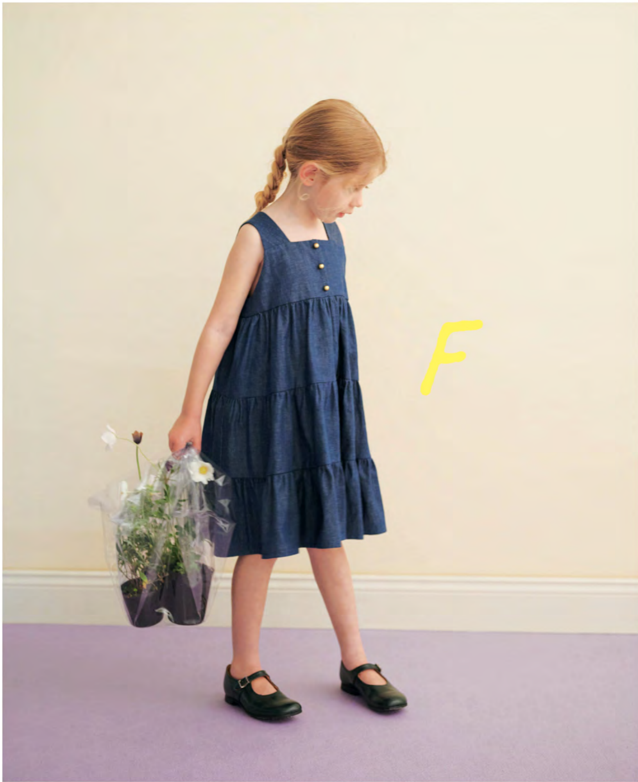
F ティアドワンピース → page. 48

ボリュームたっぷりの3段のスカートを含めたティアドワンピース。薄手のデニムで作れば、ギャザーもきれいに入ります。